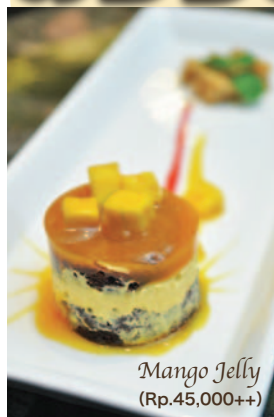
Mango Jelly (Rp.45,000++)