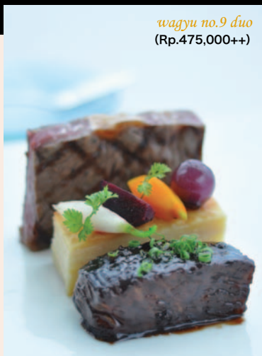
wagyu no.9 duo (Rp.475,000++)

マレーシア、オランダ、ドバイなどのホテルで経験を積み、芸術的な創作料理で各賞を受賞している。2009年のオープニングからこちらのレストランを任されている敏腕シェフ。