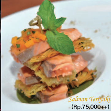
Salmon Teriyaki (Rp.75,000++)