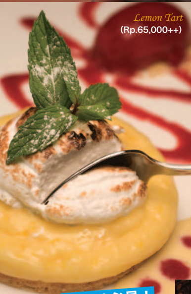
Lemon Tart (Rp.65,000++)