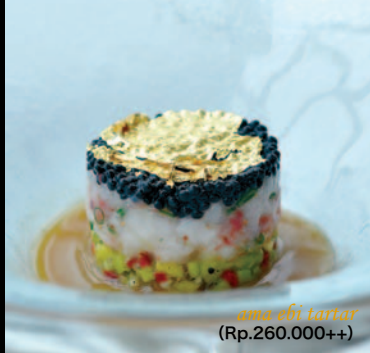
amebi tartar (Rp.260,000++)

家族がバリに遊びにくると、勤務しているホテル以外にお洒落なヴィラや最新レストランで食事をするのも楽しみなんですよ。こちらのリゾートは建設前から話題で、70mもの断崖絶壁に建つレストランが特にお気に入り。インド洋を眺望できる「ジュマナ」は、さえぎるものが何も無い絶景でその美しさは、息をのむほど。あたたかな印象のインテリアがクールに決まった極上のスペースで、ワインを片手に素敵な夜を過ごしたい方、おすすめですよ！